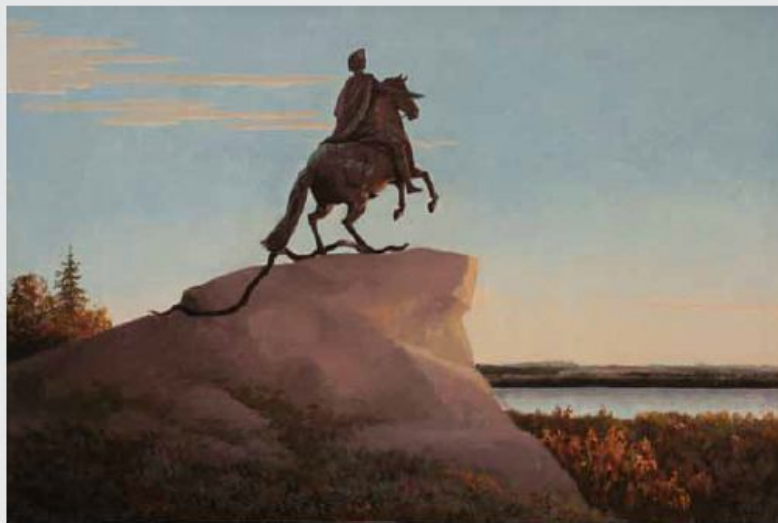
001. Здесь будет город заложен. к/м, 60x80, 2000 "There will be a city laid. c/o, 60x80, 2000"