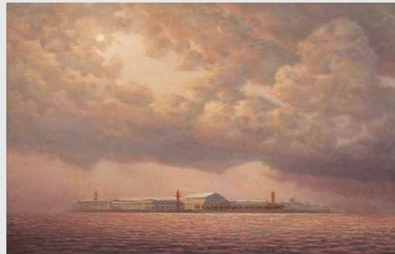
002. Сокрушительный остров. к/м, 60x80, 2000 "Vatkovsky Island. c/o, 60x80, 2000"