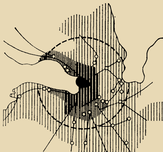
Рис. 2, 3. Схема города и его окружения в радиусе 50 км (выделены центральные районы и основные транспортные направления)