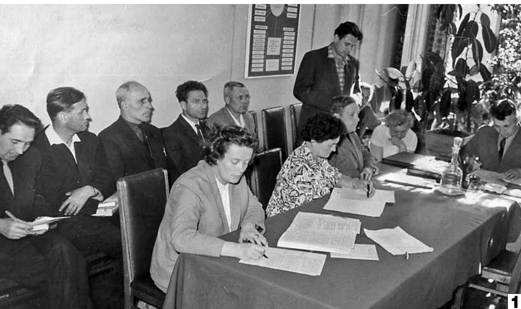
1 На совещании депутатов районного совета