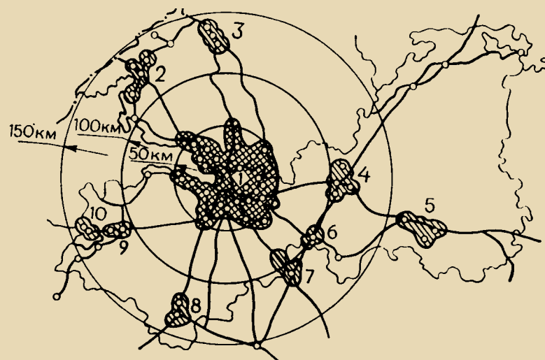
Рис. 4. Региональная система расселения