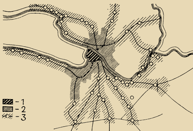
Рис. 1. Планировочная структура ленинградской системы расселения 1 – центральные районы 2 – новые районы массового жилищного строительства 3 – планировочные направления

Война прервала учебу. Первую блокадную зиму Александра Викторов-