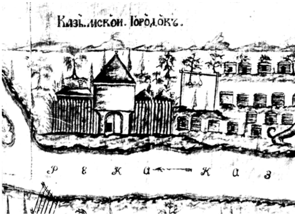
Рис. 16. Вид Казымского городка (рис. Н. Шахова)

По «Русскому тѣсу» можно было попасть на Обь, а затем в Мангазею. Туда ходили и морским путем из основанного в 1498 г. в устье р. Печоры Пустозерского острога. В середине XVI в. р. Обь показывалась уже на картах европейских географов, а когда в 1555 г. английский мореплаватель Стифен Барроу оказался около Новой Земли, он слышал от русских моряков о пути в Обское устье, как о деле давно и хорошо им известном. Давно знали о Мангазее и Строгановы. Служивший в Москве и хорошо осведомленный о русских делах голландец Исаак Масса даже считал, что Строгановы разбогатели от торговли с народами, жившими в низовьях Оби. Их приказчик ездил в 1577 г. в Мангазею сухим путем, а затем повторил это путешествие морем. В Мангазею он, вероятно, двигался через Ляпин-уш и Сумгут-Ваш, где когда-то стояли русские городки, и знал русских, отлично владевших языком местных народов, «знакомых с рекой Обью, так как посещали те места из года в год». Существовал и другой путь. Пустозерцы поднимались по р. Печоре, а затем волоками проникали к устью Оби и берегами в Мангазею. По пути они построили промысловые и торговые городки — Надымский в устье одноименной реки, Пантуев в устье Пура и несколько городков на р. Тазе.