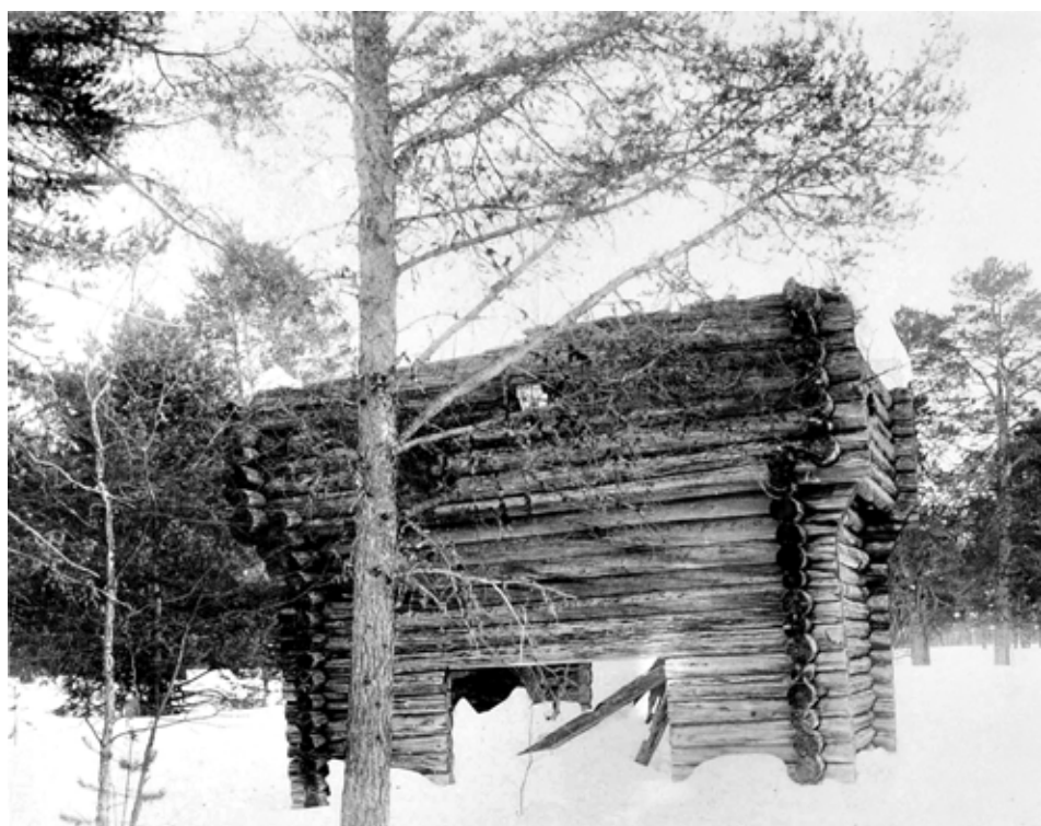
Рис. 17. Казымские башни 1 — верх 2 — низ