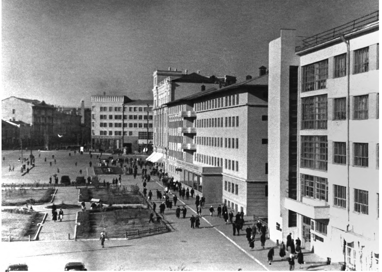
Гостиница «Интурист» (в центре) и дом легпрома (справа). Архит. В. Кочедамов, И. Иващенко

В. Кочедамов стал одним из первых архитекторов, которые принимали участие в проектировании набережной Сталинграда. К 1935 г. берег Волги в центре города представлял собой неприглядное зрелище с железнодорожной веткой и многочисленными складскими зданиями. Архитектор видел проект набережной как единый ансамбль от Царицы до водокачки, тем более им уже было спроектирован и построен ресторан «Шанхай». Он предложил спроектировать парадную центральную лестницу со скульптурой Сталину наверху. Этот проект подробно описан в параграфе «Набережные Сталинграда».